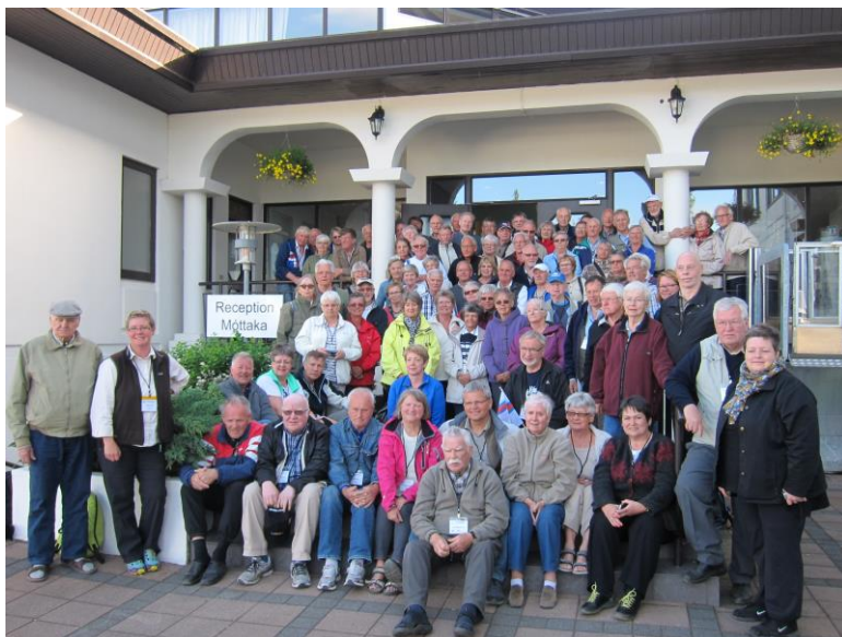
Deltagare och ledare