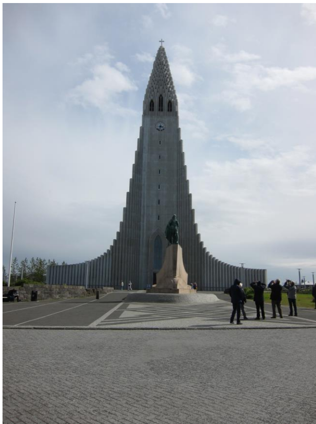
Islands största kyrka i Reykjavik