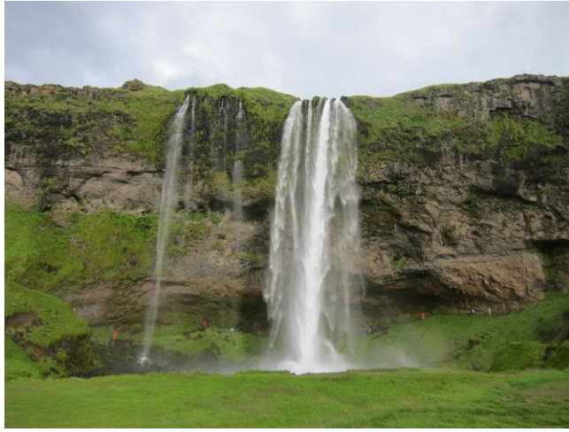
På väg tillbaka till hotellet stannade vi vid Seljalandsfoss vattenfall.